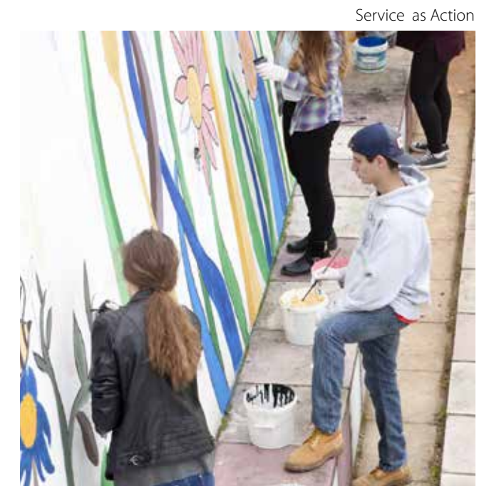
Service as Action