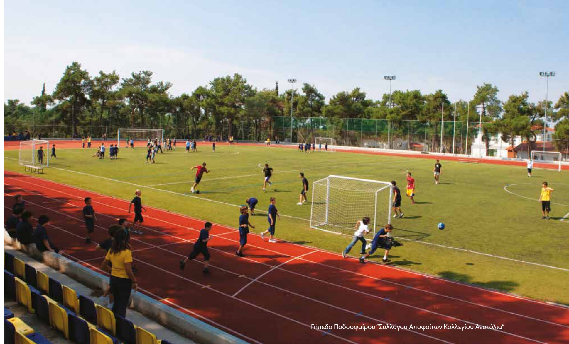
Γήπεδο Ποδοσφαίρου "Συλλόγου Αποφοίτων Κολλεγίου Ανατόλια"

Στις εξωτερικές εγκαταστάσεις βρίσκουμε τρία γήπεδα basket, τέσσερα γήπεδα volley, ένα γήπεδο handball, δύο γήπεδα ποδοσφαίρου με τεχνητό χλοοτάπητα και δύο γήπεδα tennis, ενώ υπάρχει επίσης στίβος κλασσικού αθλητισμού, καθώς και διαδρομή 2 χλμ. ανώμαλου δρόμου.