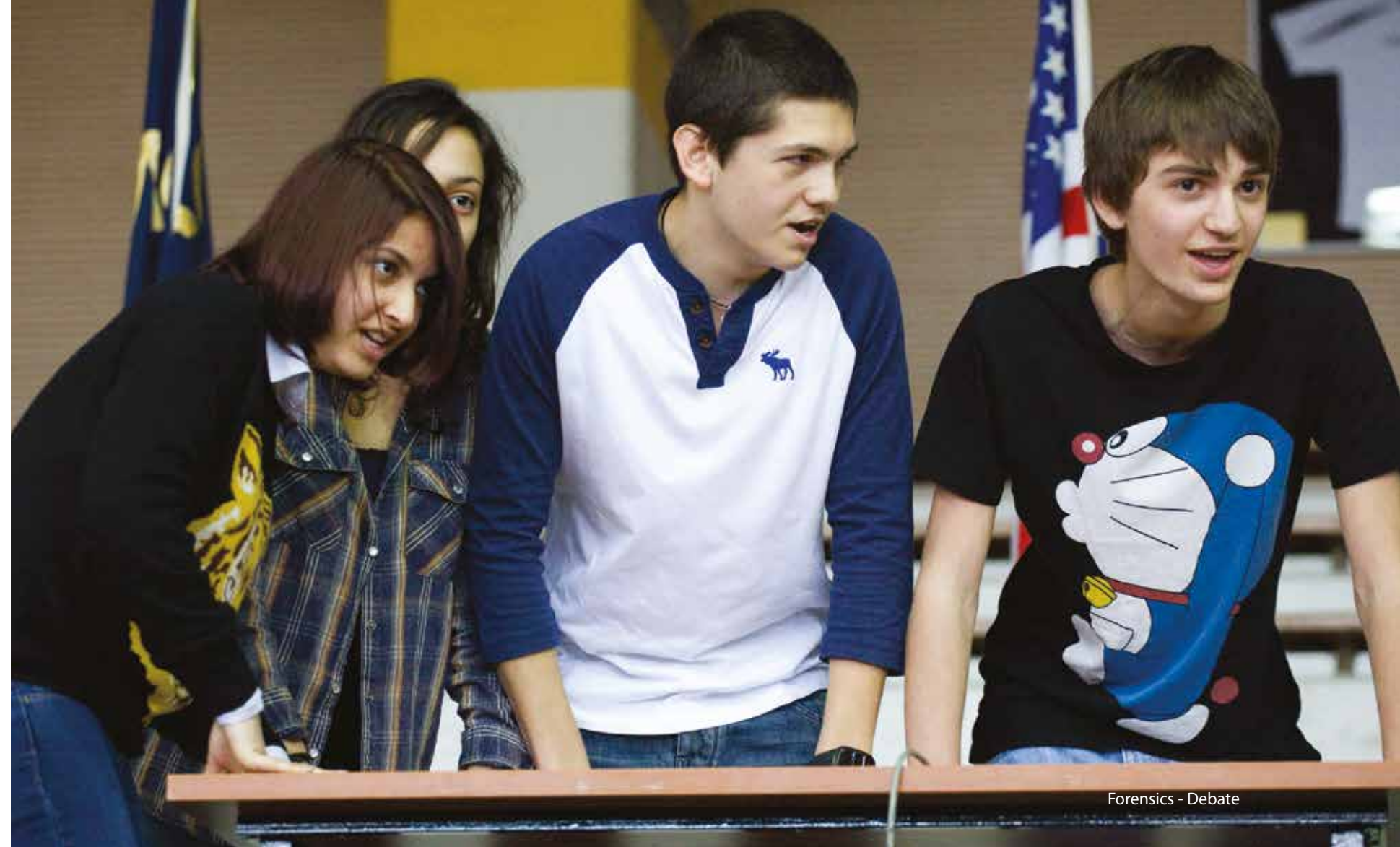
Forensics - Debate

Το Ανατόλια ήταν από τα πρώτα σχολεία που εισήγαγε τους ομίλους εξωσχολικών δραστηριοτήτων και έχει ένα από τα πιο ζωντανά προγράμματα στην Ελλάδα. Οι μαθητές μας διευρύνουν τους ορίζοντές τους και ανακαλύπτουν τα ταλέντα τους, ενώ, ταυτόχρονα εξασκούν την αγγλική γλώσσα αφού πολλοί από τους ομίλους γίνονται στα αγγλικά. Κάθε χρόνο εκατοντάδες μαθητές του Ανατόλια συμμετέχουν σε ταξίδια για να εκπροσωπήσουν το Ανατόλια σε Προσομοιώσεις Συνελεύσεων των Ηνωμένων Εθνών (MUN) , στο Harvard Model Congress , σε συνέδρια debate , στο Ευρωπαϊκό Κοινοβούλιο Νέων (EYP) και σε πολλές άλλες εκδηλώσεις στην Ελλάδα, την Ευρώπη και τις ΗΠΑ όπου έχουν τη δυνατότητα να έρθουν σε επαφή με μαθητές γυμνασίων-λυκείων από όλο τον κόσμο.